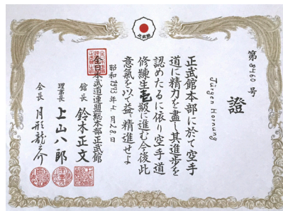
Kyu-Urkunde aus Japan